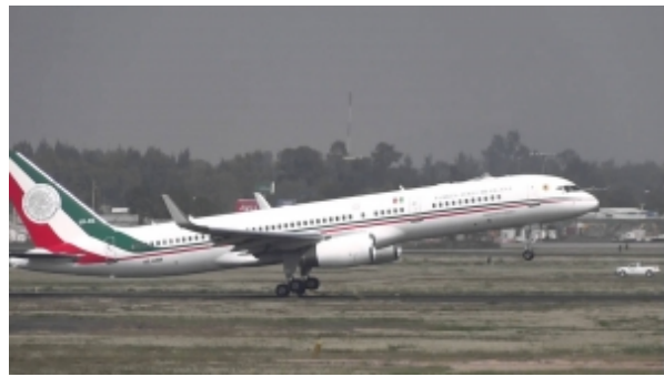
Arribará esta madrugada nuevo avión presidencial a México