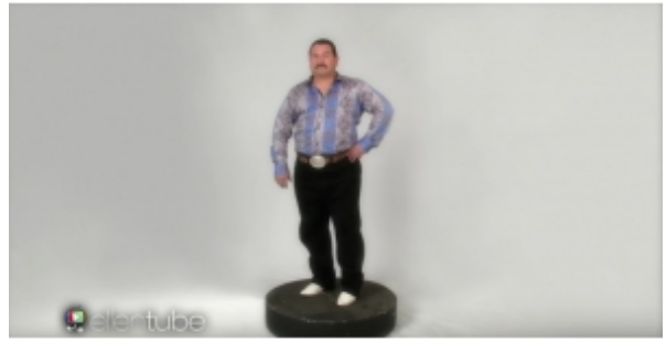
VIDEO: Presentan comercial de nueva línea de ropa 'El Chapo'