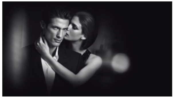
Características de un buen amante (primera parte)