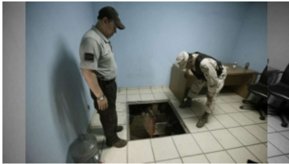
Halla PGR narcotúnel en predio de Tijuana